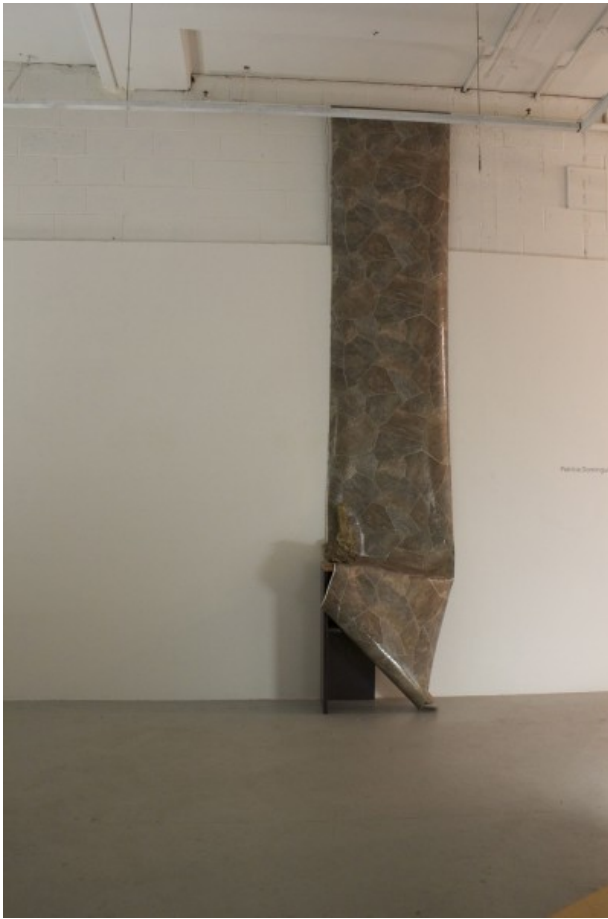
Patricia Domínguez, The Ecstatic Travel . Muestra de tesis de grado, MFA, Hunter College, NY, 2013.

Los videos de The Ecstatic Travel cuestionan la naturaleza de la búsqueda que hoy en día se produce en Internet y el cómo se hace sentido de las imágenes observadas. A través de un viaje ficticio por pantallas, links y pixeles, se establece una analogía contemporánea a los viajes de antropólogos y etnógrafos y su búsqueda de lo exótico y del otro. A través de un código diseñado especialmente para viajar en el archivo digital, se accede a los especímenes a través de fragmentos abstractos y se fuerza al espectador a establecer una proximidad visual a éstos, requiriendo una cantidad de tiempo específico, casi incómodo, de observación. En el archivo, pasar de una imagen a otra requiere más lentitud y atención que lo que usualmente requiere navegar Google.